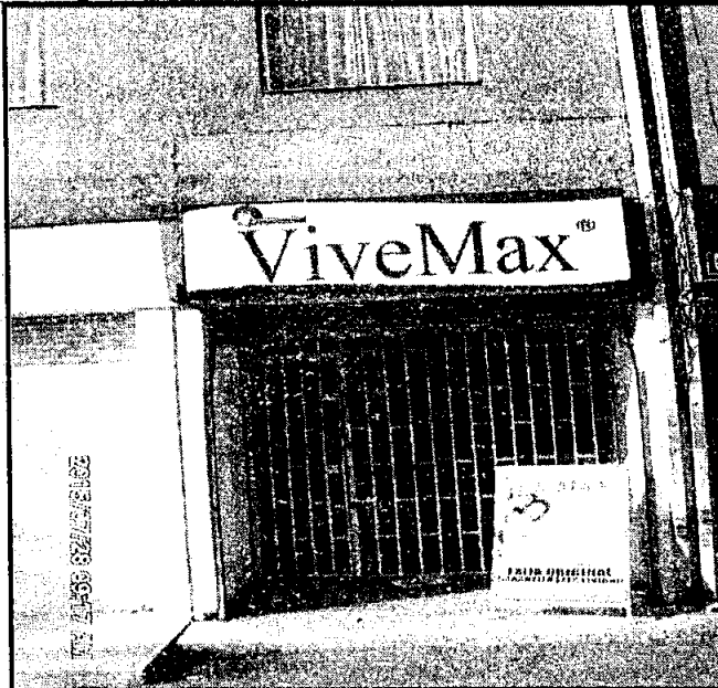
Fotografía No. 1: COMERCIALIZADORA ARVE SAS. Ubicado en la dirección CALLE 26 SUR No. 78 - 44

Registro fotográfico, Visita No. 1 efectuada el día 28/07/2015