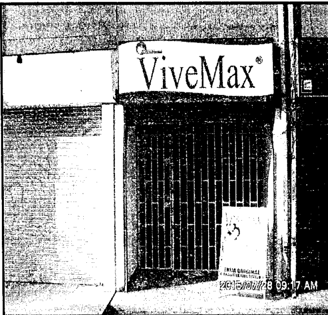
Fotografía No. 2: COMERCIALIZADORA ARVE SAS. Ubicado en la dirección CALLE 26 SUR No. 78 - 44